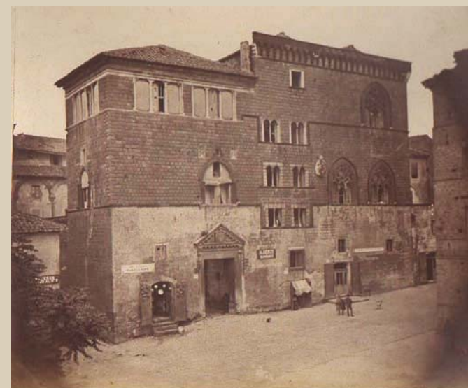
Esterno del Palazzo Pubblico esistente in Comune Tarquinia

Sabato 8 e Domenica 9 Ottobre presso la Sala Consiliare del Comune di Tarquinia